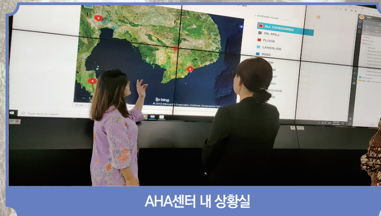
AHA센터 내 상황실